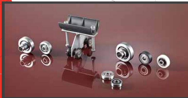
Cuscinetti a sfera | Bearings | Kugellager