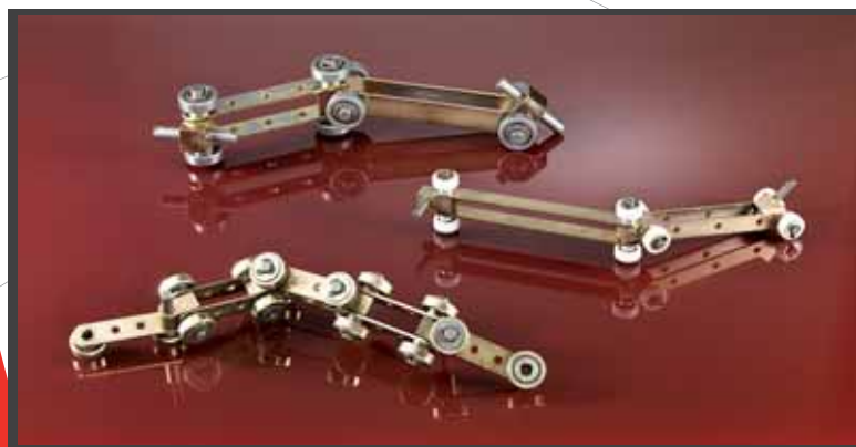
Catene per trasportatori | Chains for conveyors | Ketten für Förderanlagen