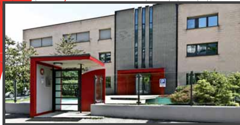
Sede produttiva | Plant | Produktionswerk